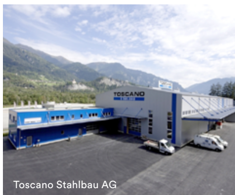
Toscano Stahlbau AG