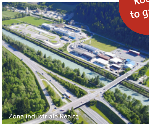
Zona industriale Realta