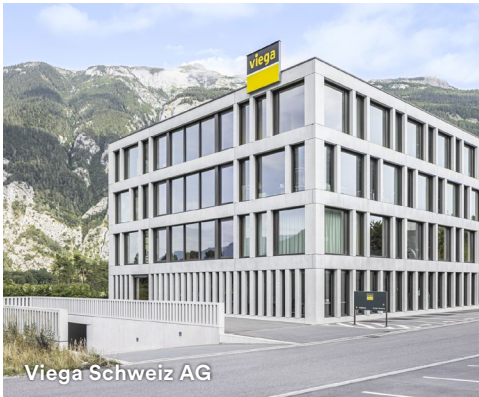
Viega Schweiz AG