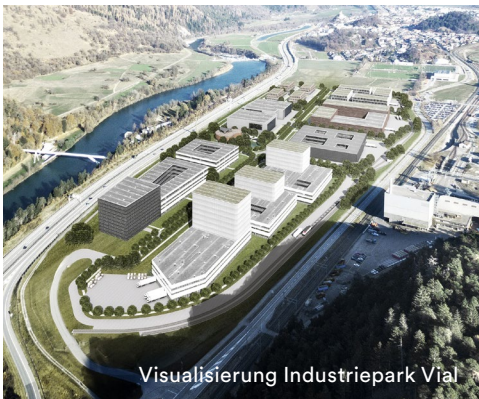
Visualisierung Industriepark Vial