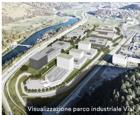
Visualizzazione parco industriale Vial