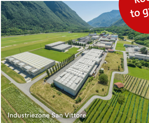
Industriezone San Vittore