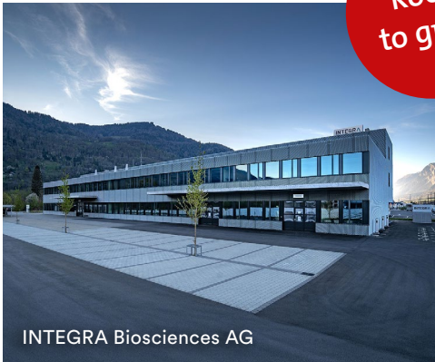
INTEGRA Biosciences AG