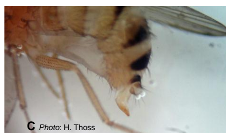
C Photo: H. Thoss