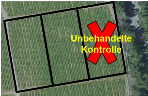
Abb. 1: Mögliche Versuchspartelle, wobei die unbehandelte Kontrolle nicht direkt an eine Hecke angrenzen sollte.

*Versuche zu Entlaubung und Netzen können allenfalls auch kleinräumiger durchgeführt werden.