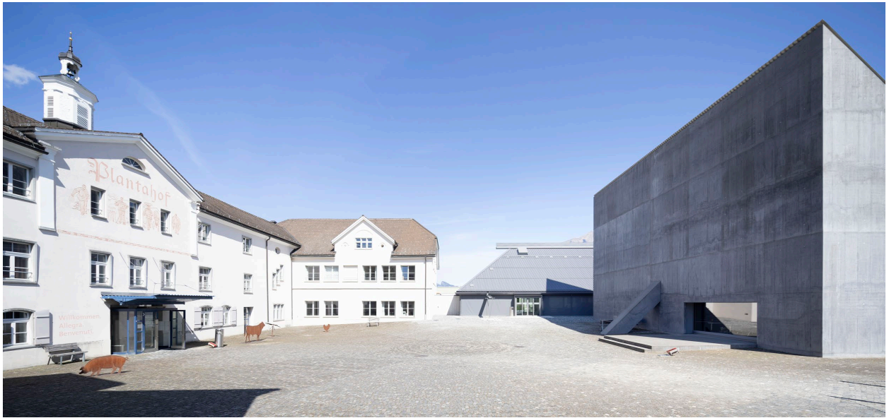
Abbildung 1