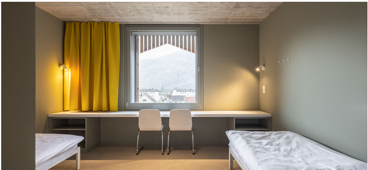
Abbildung 18