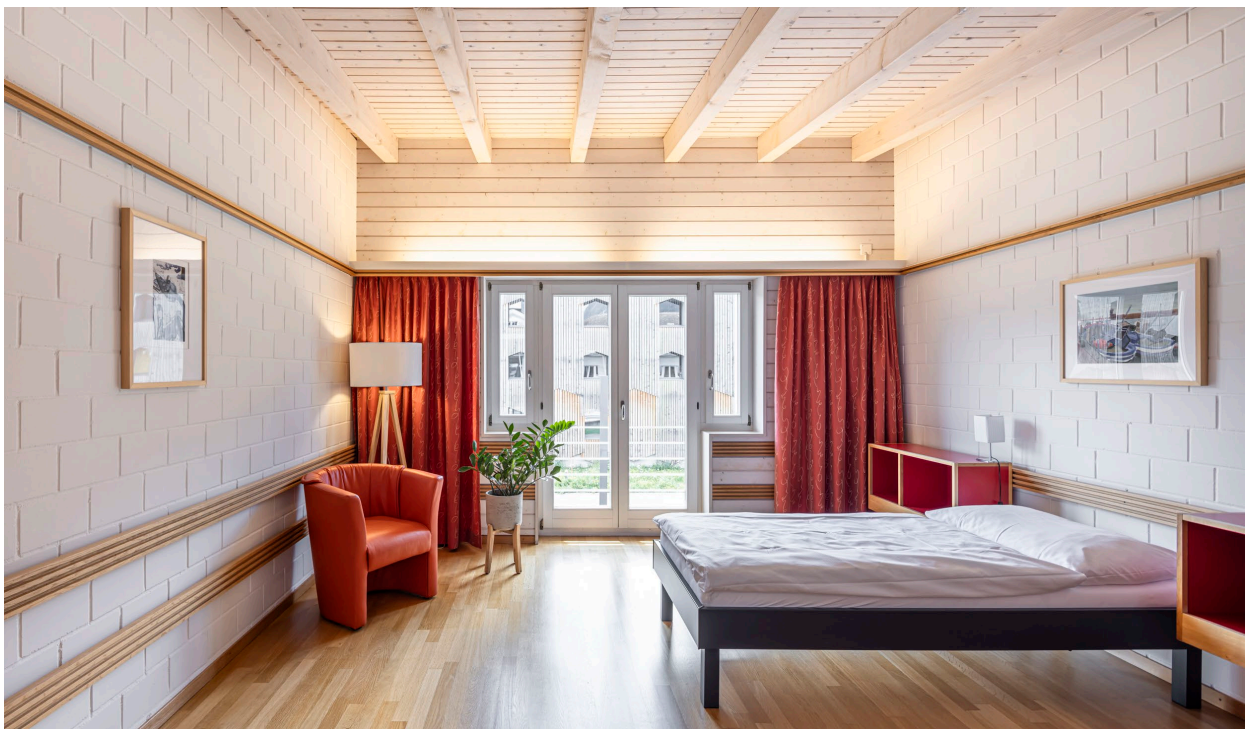
Abbildung 16