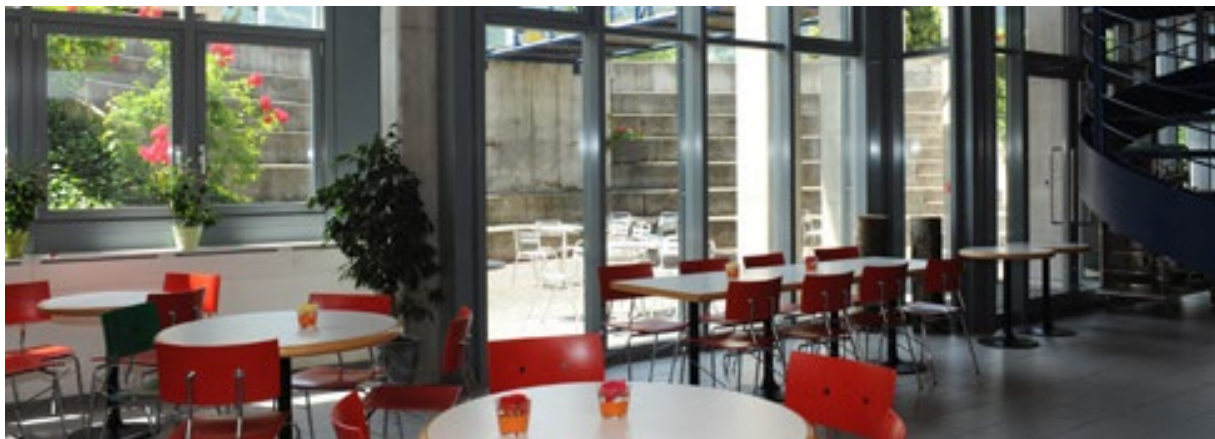
Abbildung 21 internes Foto

In unserer Cafeteria können Sie jederzeit zu sehr guten Konditionen einen feinen Kaffee oder Tee konsumieren. Der offen gestaltete Raum bietet Platz für rund 130 Gäste und im Sommer lädt eine kleine Arena im Aussenbereich zum Verweilen ein.