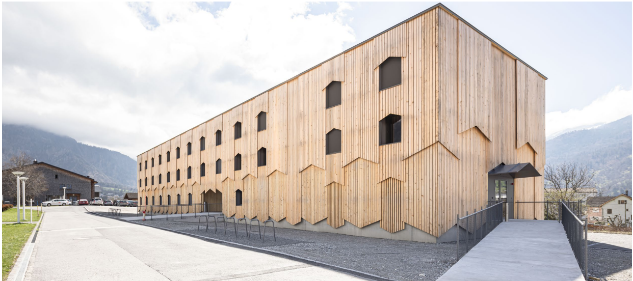
Abbildung 17