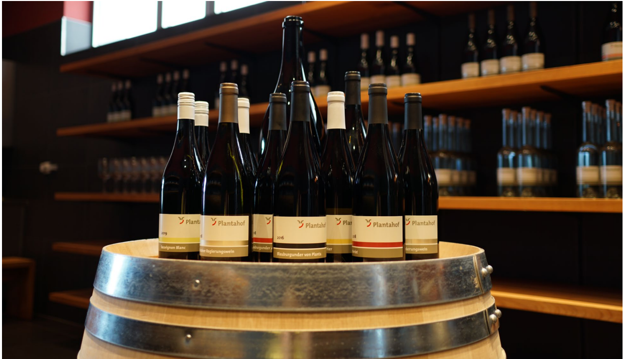
Abbildung 19 internes Foto

Wir servieren Ihnen bei einem Apéro oder auf Wunsch auch zum Mittagessen einen passenden von uns produzierten und gekelterten Wein.