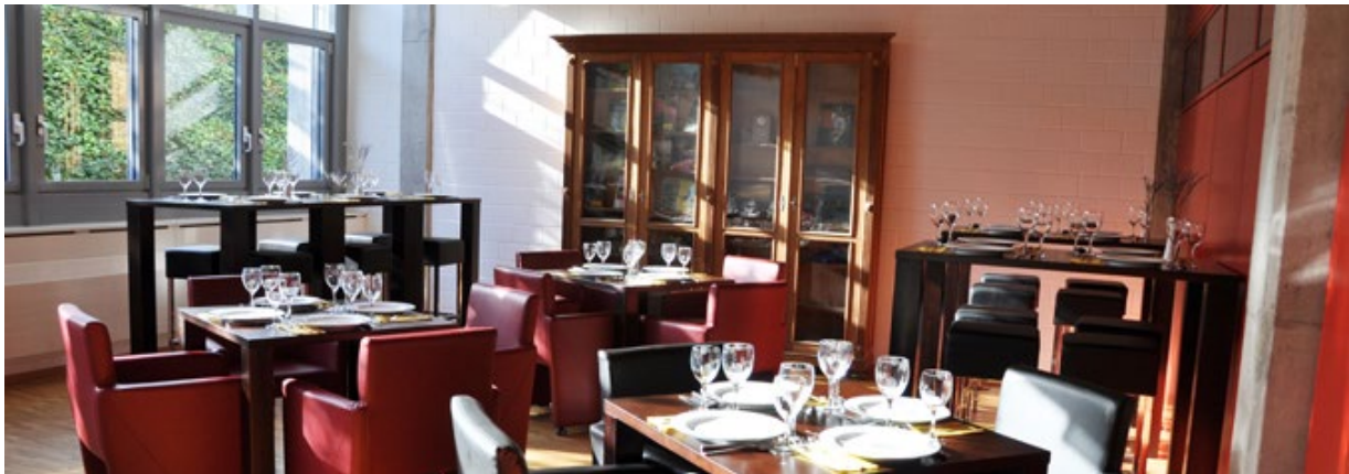
Abbildung 22 internes Foto

Beim gemütlichen Zusammensein in unserer Lounge genießen Sie den Abend.