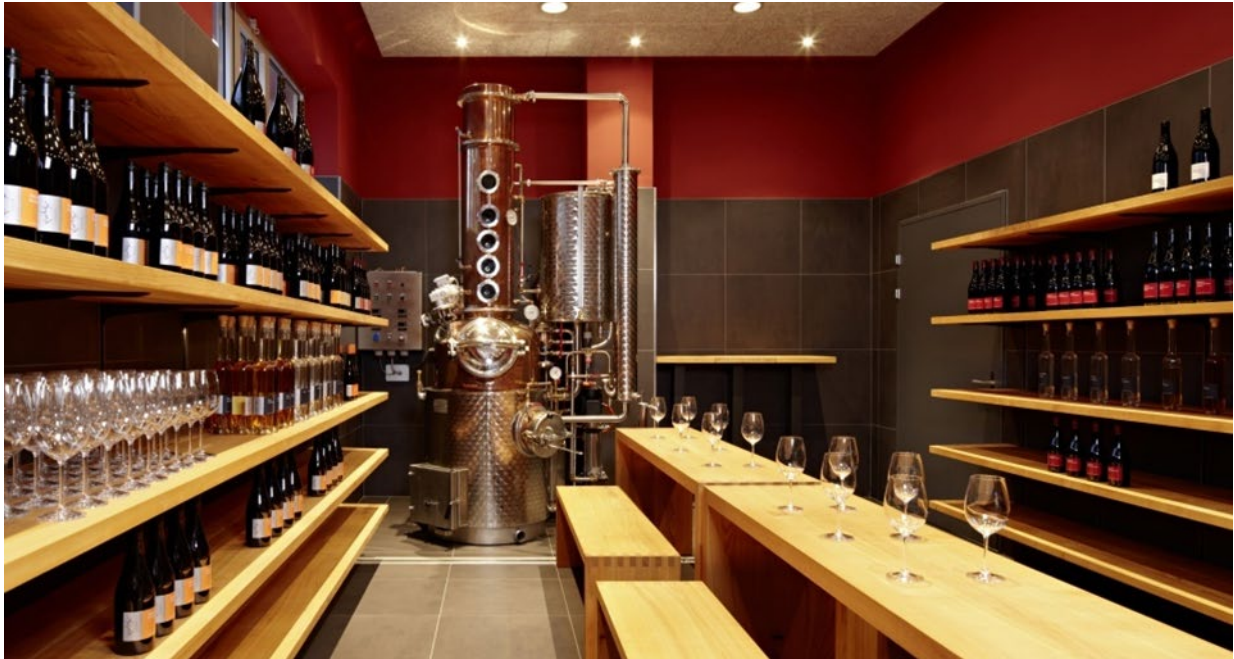
Abbildung 20 internes Foto

Wir bieten Betriebsführungen und Wein Degustationen an.