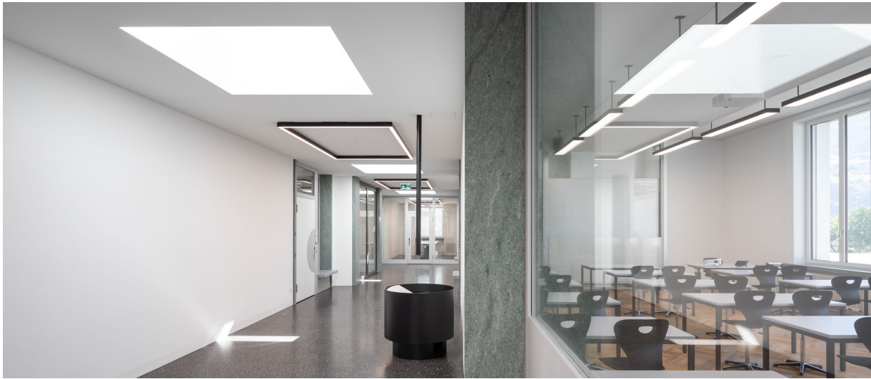
Abbildung 14

Die Schulzimmer sind technisch hochstehenden eingerichtet und bieten mit den geölten Parkettböden eine wohnliche Atmosphäre.