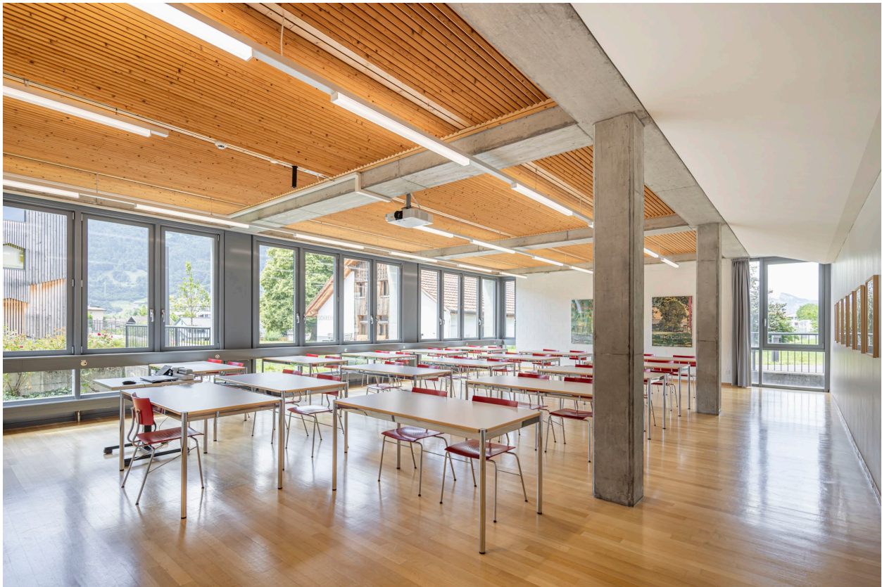
Abbildung 9

Der Belvedere-Saal ist ein funktionaler, grosszügiger Tagungsraum. Ein idealer Platz, um eine wichtige Tagung in einer angenehmen, hellen Raumatmosphäre erfolgreich gelingen zu lassen.