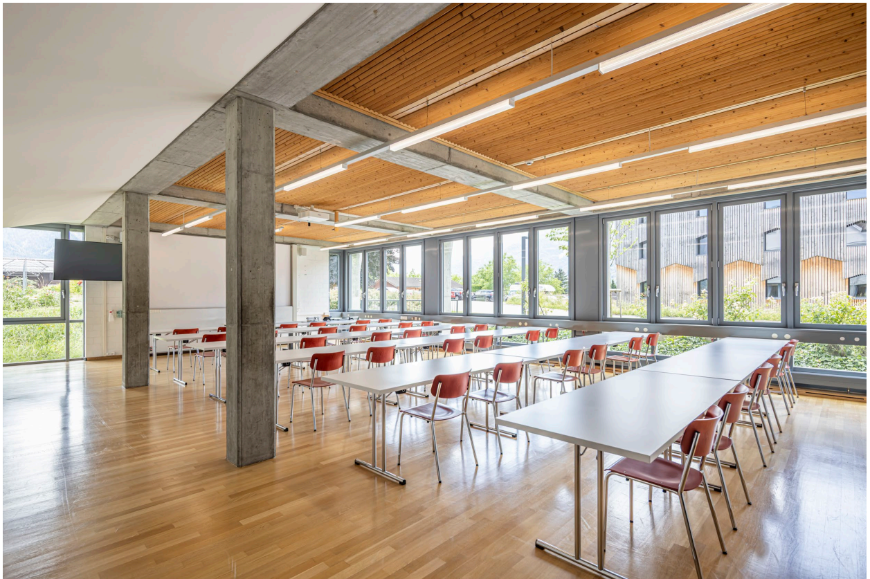
Abbildung 10

Die Briula ist ein funktionaler, grosszügiger Tagungsraum. Ein idealer Platz um eine wichtige Tagung in einer angenehmen, hellen Raumatmosphäre erfolgreich gelingen zu lassen.