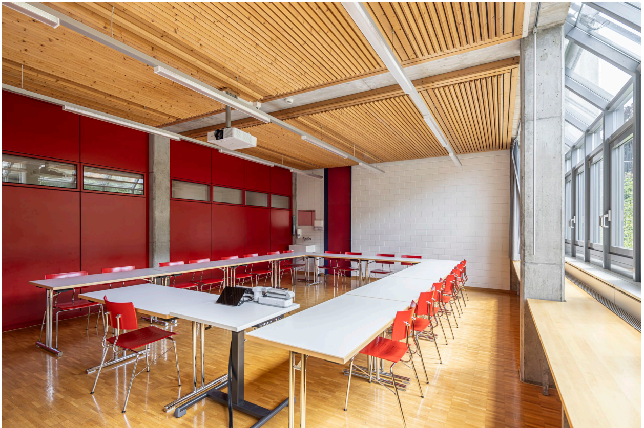
Abbildung 5

Die Bäuerinnen-Stube befindet sich beim Haupteingang im Tiefparterre neben der Cafeteria. Zentrale Lage. Praktischer Raum für kleinere Schulungen. Ein unspektakulärer Blick, der zügiges Arbeiten zulässt und nicht ablenkt und man sich so auf das Wesentliche konzentrieren kann.