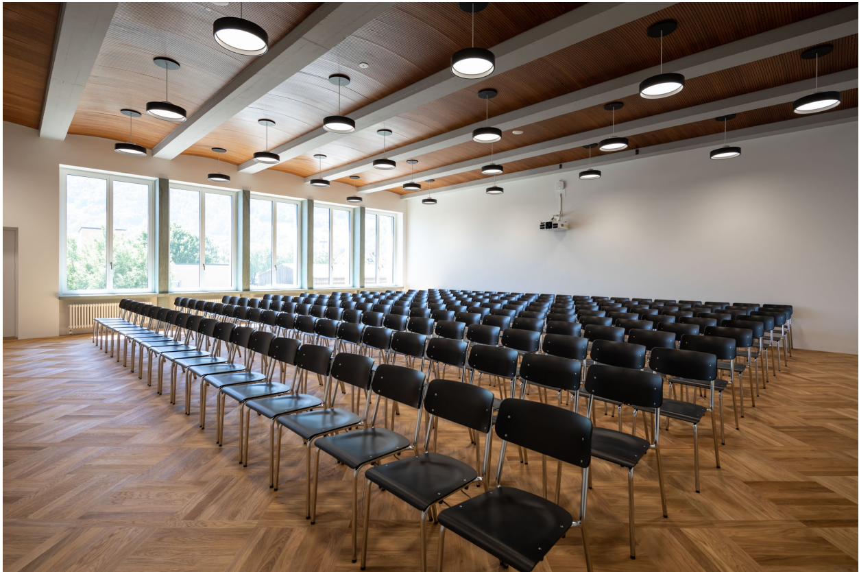
Abbildung 7

Der Züchtersaal bietet die ideale Voraussetzung für grössere Anlässe. Mit unserer farbenfrohen Bestuhlung und allen nötigen Einrichtungen erfüllt er alle Voraussetzungen für das Gelingen eines Vortrages oder Podiumsgespräches.