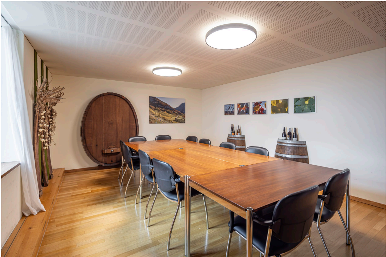
Abbildung 2

Die Winzer-Stube bietet direkten Blick auf den historischen Vorplatz des Haupteinganges. Idealer Standort für kleine, kurze Besprechungen oder zur Nutzung als Gruppenraum während Tagungen.