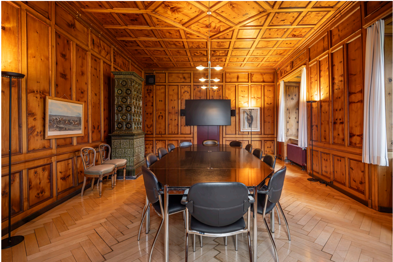
Abbildung 1

Die Arven-Stube ist ein Raum mit Flair und Charme. Mit seinem alten historischen Kachelofen und dem wunderbaren Blick in unseren Garten lässt er alte Zeiten aufblühen und sicher manche unkonventionellen Gedanken und Gespräche zu. Ein spezieller Raum mit Charakter und Charisma. Ideal für kleinere Zusammenkünfte oder auch zur Nutzung von Gruppenräumen bei Tagungen geeignet. Dieser Raum wird nur unter Tags für externe Gäste zur Verfügung gestellt.