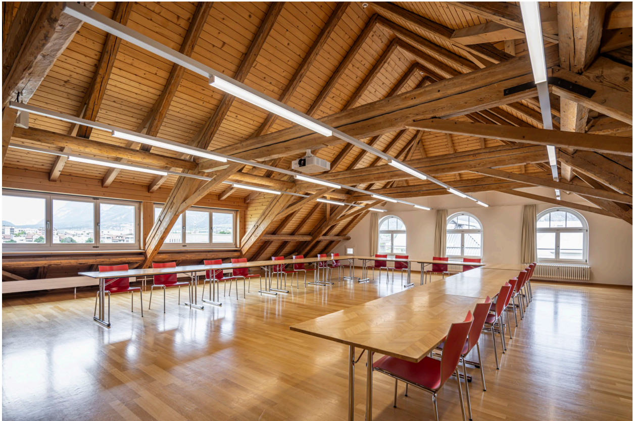
Abbildung 8

Der Von-Planta-Saal bildet sozusagen das Herzstück des Plantahofs. Mit seinem Original-Dachstock aus den Gründerzeiten von Rudolf von Planta verleiht es dem Raum die entsprechende Atmosphäre und Ausstrahlung. Vom Dachstock aus genießen sie einen Rundblick auf unseren Eingangsplatz zum Internatsgebäude bis zu unserem wunderbaren Obstgarten Richtung Bündner Herrschaft.