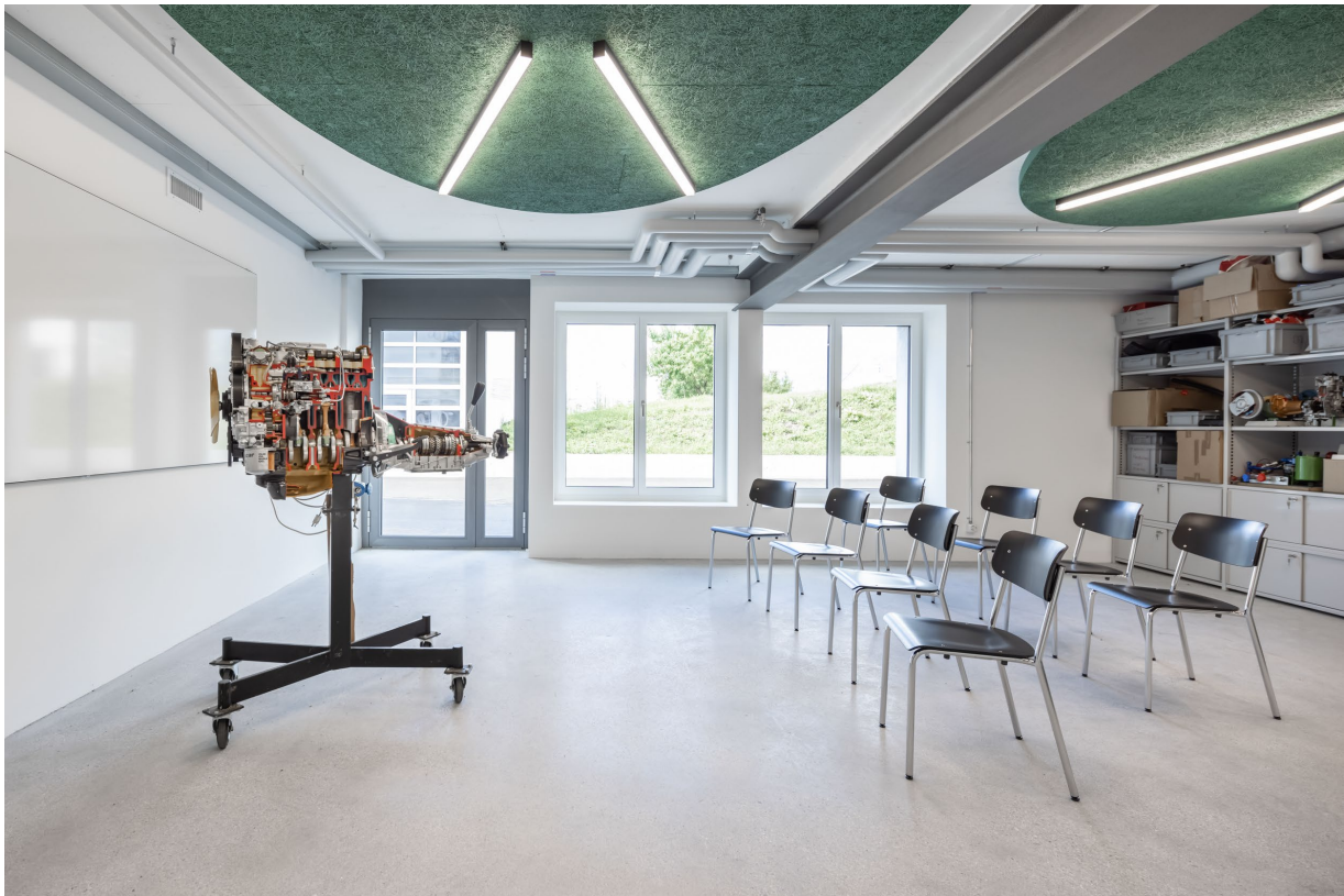
Abbildung 12

Der Briula-Saal ist ein funktionaler, grosszügiger Tagungsraum. Ein idealer Platz, um eine wichtige Tagung in einer angenehmen, hellen Raumatmosphäre erfolgreich gelingen zu lassen.