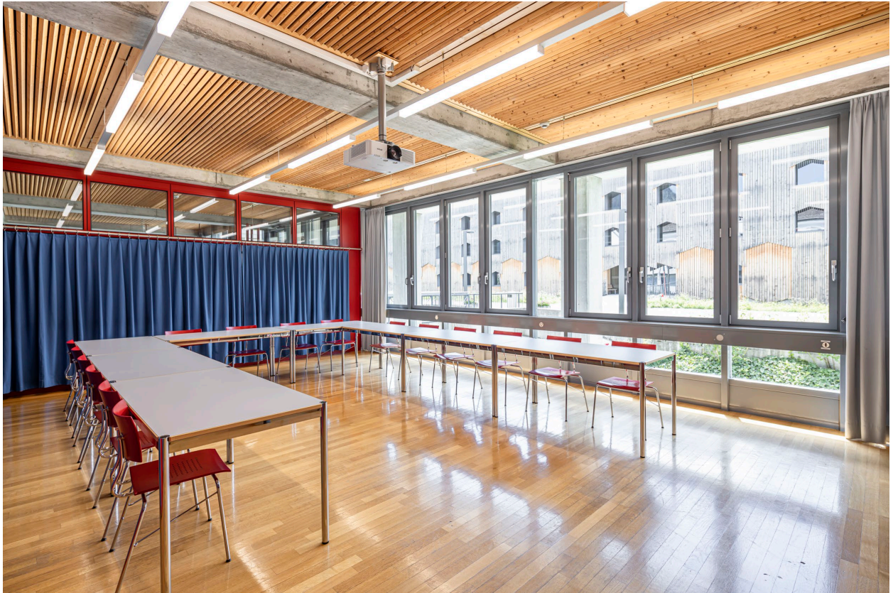
Abbildung 3

Die Ursulina-Pult-Stube bietet die nötigen Grundlagen für ein unkonventionelles Arbeiten in einer Kleingruppe. Mit Blick Richtung Hintereingang und Verkaufsladen liegt er äusserst zentral und ist unweit von der Cafeteria entfernt. Ein praktischer Raum der sich für speditive Sitzungen und Zusammenkünfte im kleineren Rahmen eignet.