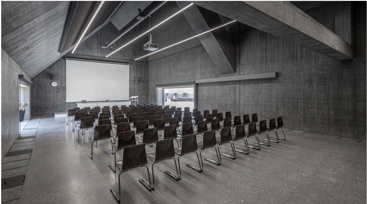
Abbildung 6

Das Stifterehepaar Carl und Trudy Weber-Recoullé hatten eine tiefe Verbundenheit mit dem Berggebiet und unterstützen in der Weiterbildung die Bergbauern im Kanton. Der Weber-Hörsaal ist ein idealer Ort in einer innovativen Umgebung für mittelgrosse Konferenzen. Gemäss dem Architekten, Valerio Olgiati, wirkt das Gebäude in der grossräumigen, flachen Umgebung von Landquart wie ein Fels.