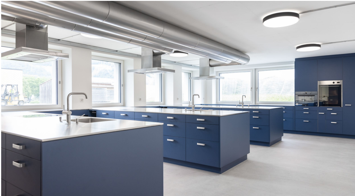
Abbildung 11

Das Kochstudio hat 4 Kochinseln mit den üblichen Hilfsmitteln. Verlangen Sie das separate Inventar. Vor dem Studio gibt es ein Schulzimmer mit den üblichen Hilfsmitteln. Speziell sind die elektrischen Anschlüsse für Bügelbretter und 4 Lavabos im Schulungsraum.