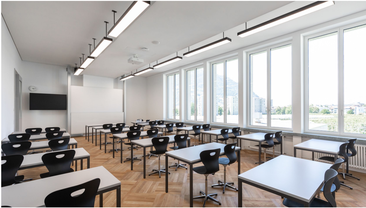
Abbildung 13

gross SZ05 & SZ15 88.9 & 79.6 m 2 (geeignet für max. 36 Personen)