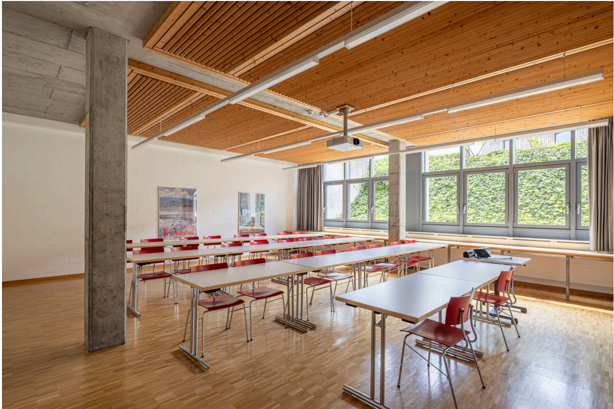
Abbildung 4

Die Pflanze-Stube befindet sich beim Haupteingang im Tiefparterre neben der Cafeteria. Zentrale Lage. Praktischer Raum für kleinere Schulungen. Ein unspektakulärer Blick, der zügiges Arbeiten zulässt und nicht ablenkt und man sich so auf das Wesentliche konzentrieren kann.