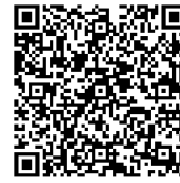
Berufliche Grundbildung und Leistungssport