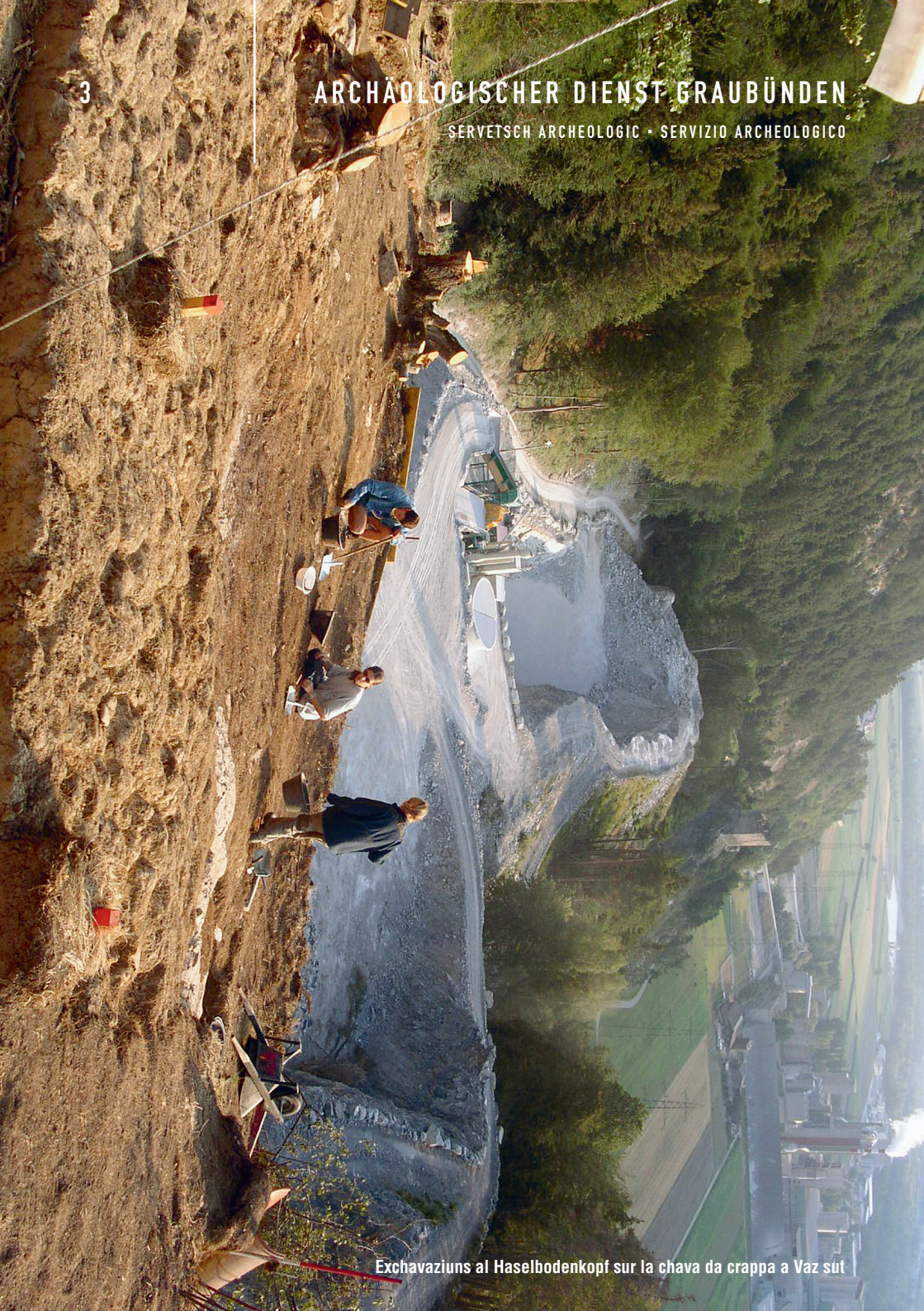
Exchavaziuns al Haselhodenkopf sur la chava da crappa a Vaz sut

SERVETSCH ARCHEOLOGIC • SERVIZIO ARCHEOLOGICO