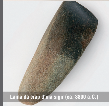
Lama da crap d'ina sigir (ca. 3800 a.C.)