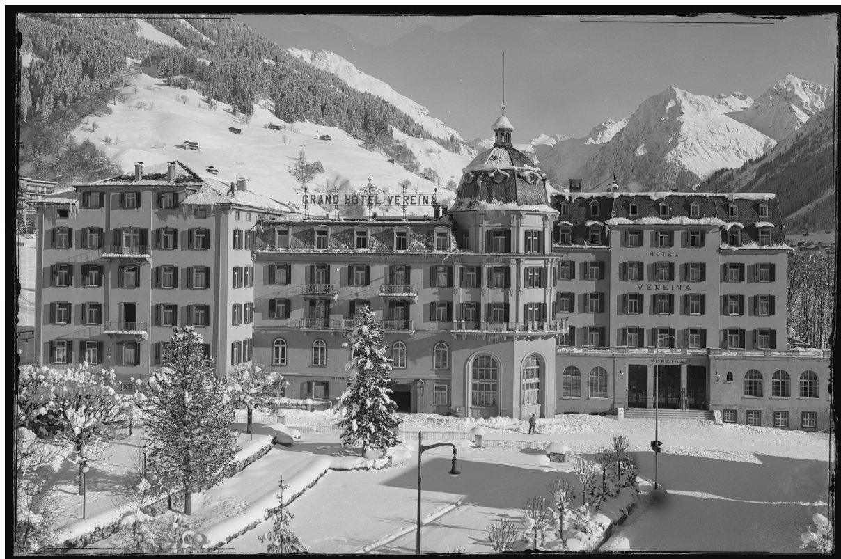
StAGR FN XXIX / 108 b: Jakob Compeer: Hotel Vereina Klosters ca. 1950

Findmittel PDF / Archivinformationssystem