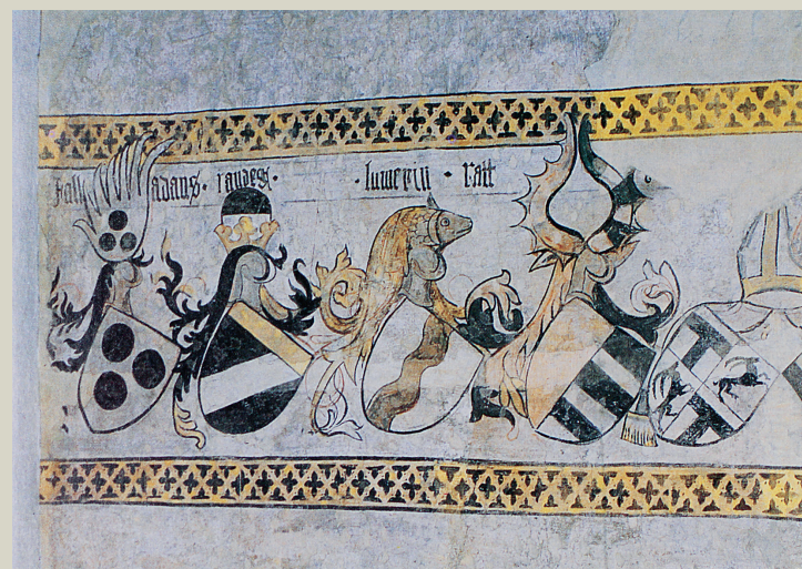
Die Herren von Lumerins in guter Gesellschaft. Ausschnitt aus der Wappenreihe im ehemaligen Disentiser Klosterhof in Ilanz (Wandbild, um 1430).

408 Seiten mit Illustrationen, Hardcover mit Fadenheftung und Schutzumschlag, Format 160 x 230 mm ISBN 978-3-85637-449-5; Kommissionsverlag Desertina CHF 49.– / EUR 30 (exkl. Versandkosten)