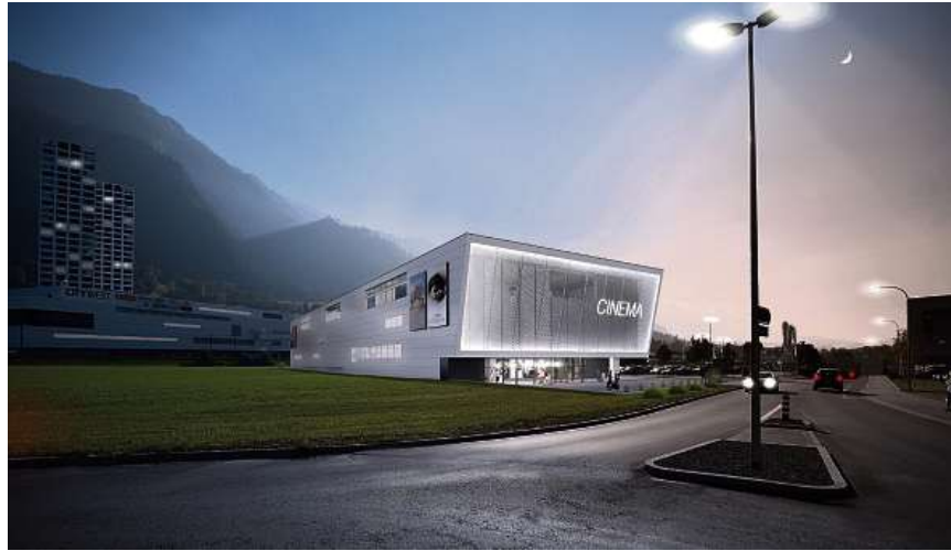
Visualisierung Domenig Immobilien AG