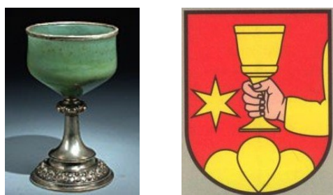
In chalesch (Stauf) e sia concepziun eraldica bidimensiunala en il scut da la vopna da la famiglia Stauffer.

Entaifer il scut d'ina vopna è la perspectiva malvesida. Mo fitg paucs objects enconuscents tridimensiunals pon forsa avair indispensablmain ina preschentaziun cun in pitschen reliev en il scut d'ina vopna, per ch'els restian vesaivels.