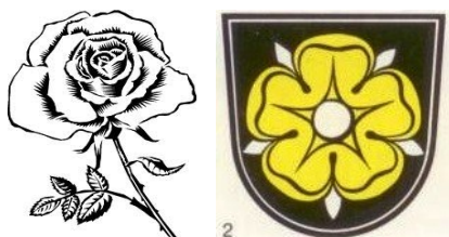
La rosa natirala e ses pendant stilisà en il scut d'ina vopna.

Ord motifs da l'effect a distanza duain las figuras da la vopna vegnir stilisadas. Cun simplifitgar e cun exagerar las caracteristicas d'in element daventan ils maletgs perceptibels er sin lungas distanzas. Tschertas figuras che vegnan avant savens han survegnì ina furma tipica en l'eraldica (sco p.ex. liuns, evlas, rosas, gilgias) ch'è per part fitg differenta da las conturas da lur exempels natirals. Muntognas na duain dal rest mai vegnir represchentadas en ina furma natirala.