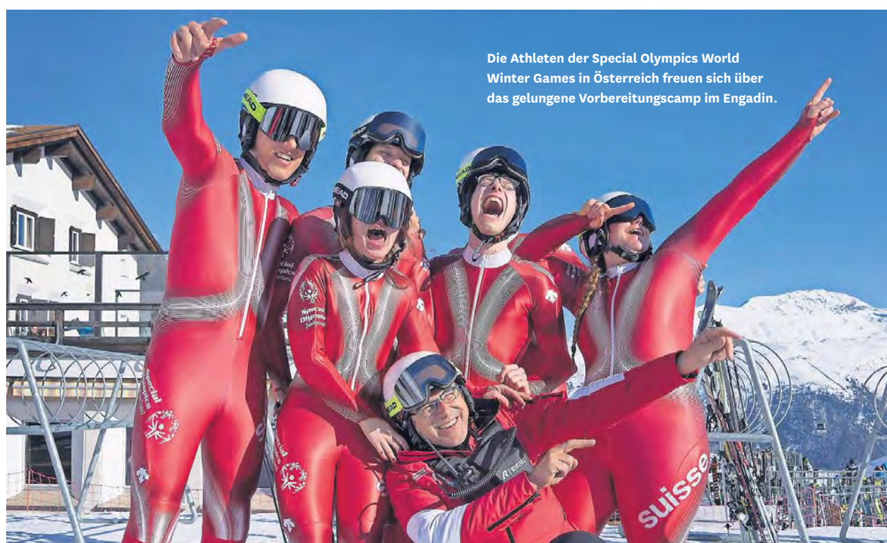
Die Athleten der Special Olympics World Winter Games in Österreich freuen sich über das gelungene Vorbereitungscamp im Engadin.