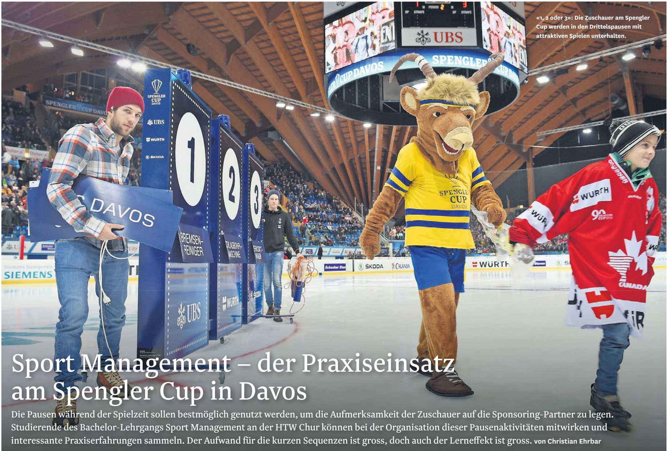
«1, 2 oder 3»: Die Zuschauer am Spengler Cup werden in den Drittelpausen mit attraktiven Spielen unterhalten.