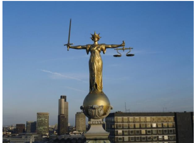
Grafik: Encyclopedia Britannica