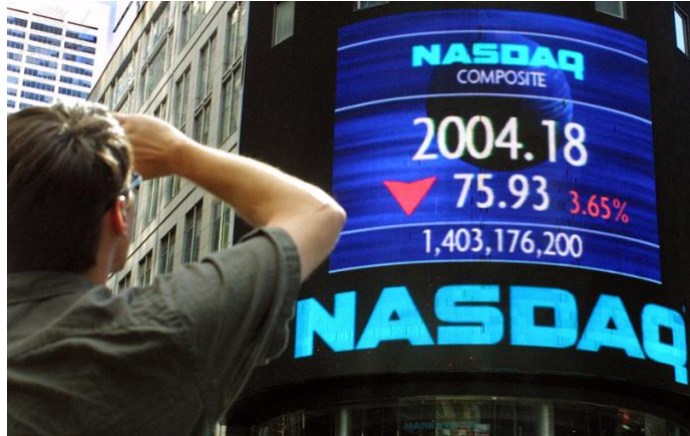
Grafik: Encyclopedia Britannica