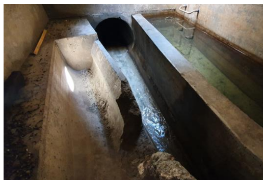
Figura 2: Sopralluogo di uno scaricatore di piena