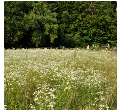
Auf Jahre hinaus viel Arbeit

Aufwand zur Tilgung: 80 Stunden in 5-6 Jahren