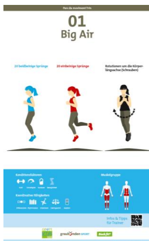
Layout del cartello di una postazione

Viene messo a disposizione il sistema di cartelli Parc da movement (tabella 1)