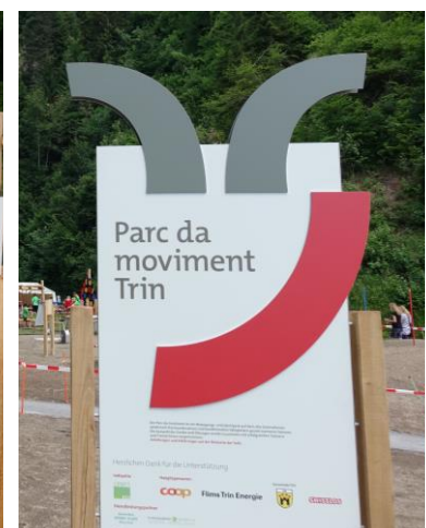
Cartello d'entrata 2m per 1m