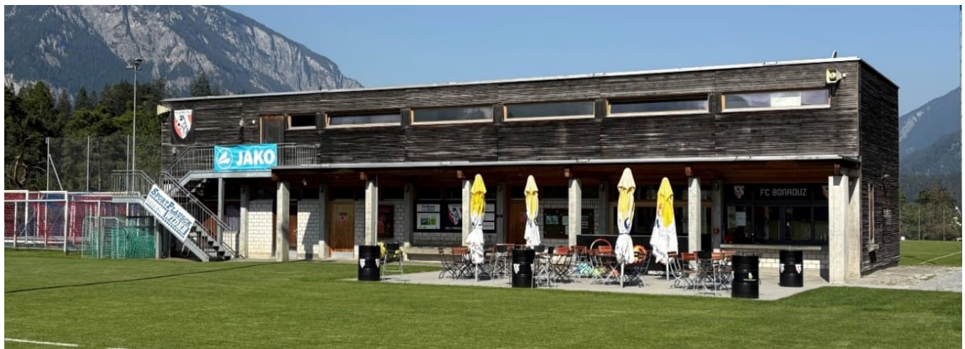
Aussenansicht und Charakter des bestehenden Gebäudes bleiben unverändert

Eine umfassende Modernisierung und Erweiterung der Infrastruktur ist daher dringend notwendig, um den Sport- und Vereinsbetrieb weiterhin effizient, sicher und normgerecht gewährleisten zu können.