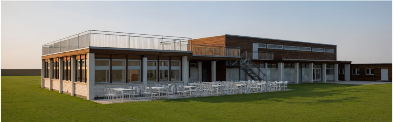
Frontansicht (West): Erweiterungsanbau (links) und bestehendes Gebäude (rechts)