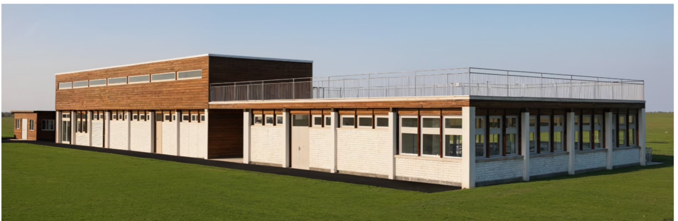
Ansicht der Rückseite (Ost): neuer Zugang zum Sportplatzareal (Mitte), bestehendes Gebäude (links) und Erweiterungsanbau (rechts)