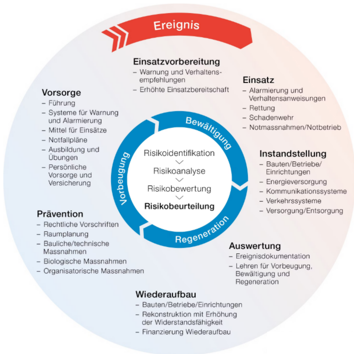
Illustraziun 2: © UFPP, «Integrales Risikomanagement», 2019

Per pudair garantir e megliar cuntinuadamain en il chantun Grischun er en l'avegnir la protecziun da la populaziun e sias basas d'existenza, è vegnida controllada la situaziun da periclitaziun ed actualisada la valitaziun da las ristgas sco er vegni identifitgà il basegn d'agir. En il center da la reelavuraziun èn stads mo eveniments che pon chaschunar ina situaziun speziala e/u extraordinaria en il chantun Grischun e ch'èn fitg pretensius per il sistem da cooperaziun da la protecziun da la populaziun, quai sin basa dal «Leitfaden KATAPLAN –die kantonale Gefährdungsanalyse» (UFPP; 27 da november 2019) e sin fundament dal «Integrales Risikomanagement» da la Confederaziun (UFPP; 2019, [cf. illustraziun 2]).