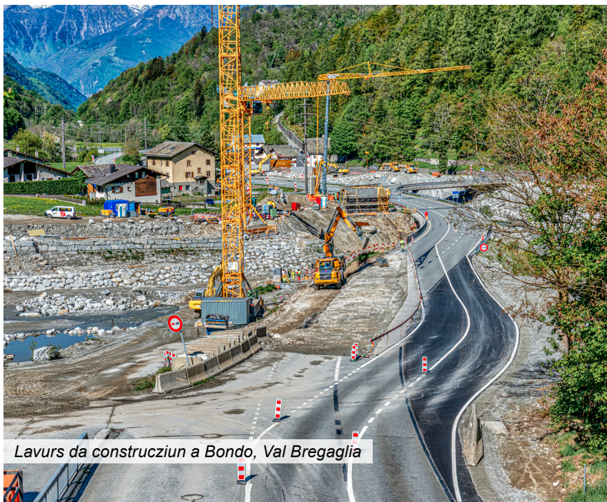
Lavurs da construcziun a Bondo, Val Bregaglia

Perquai che la stagiun da construcziun en il chantun Grischun è curta per motivs da l'aura, è ina planisaziun conscienziusa da tut ils plazzals indispensabla. Mo uschia sa lascha il temp che stat a disposiziun trair a niz en moda optimala e las restricziuns per il traffic pon uschia vegnir minimadas uschè bain sco pussaivel. En quest connex resguarda l'Uffizi da construcziun bassa (UCB) en spezial il temp da vacanzas principal.