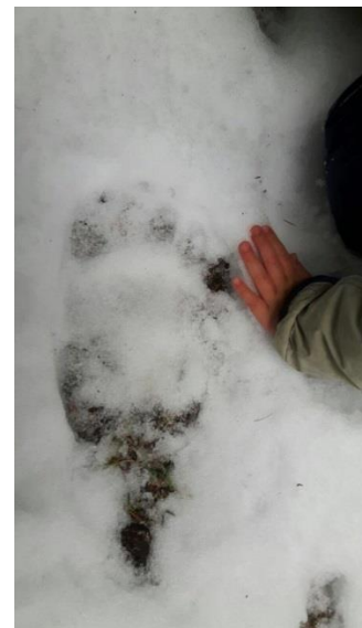
Spurennachweis aus Susch

Einige durch Privatpersonen erfolgte Bärenbeobachtungen konnten durch die Wildhut nicht bestätigt werden und fallen deshalb in die Kategorie unbestätigte Ereignisse.