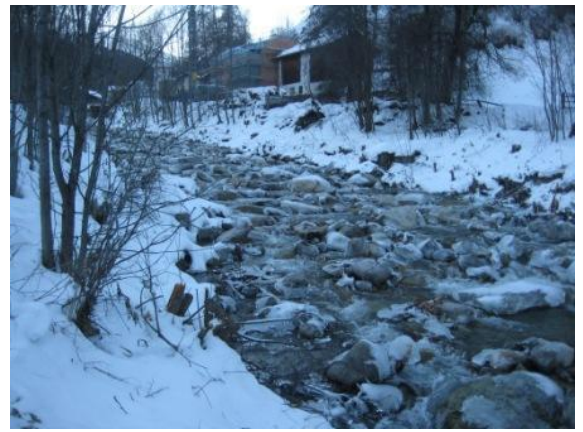
Nachher: Sicht von unten