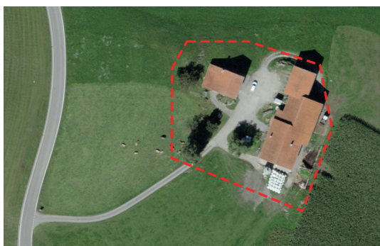
Ill. 1: Separazione di un centro aziendale

Di norma vengono separati singoli edifici abitativi o stalle, interi centri aziendali, stalle esterne isolate o abitazioni temporanee.