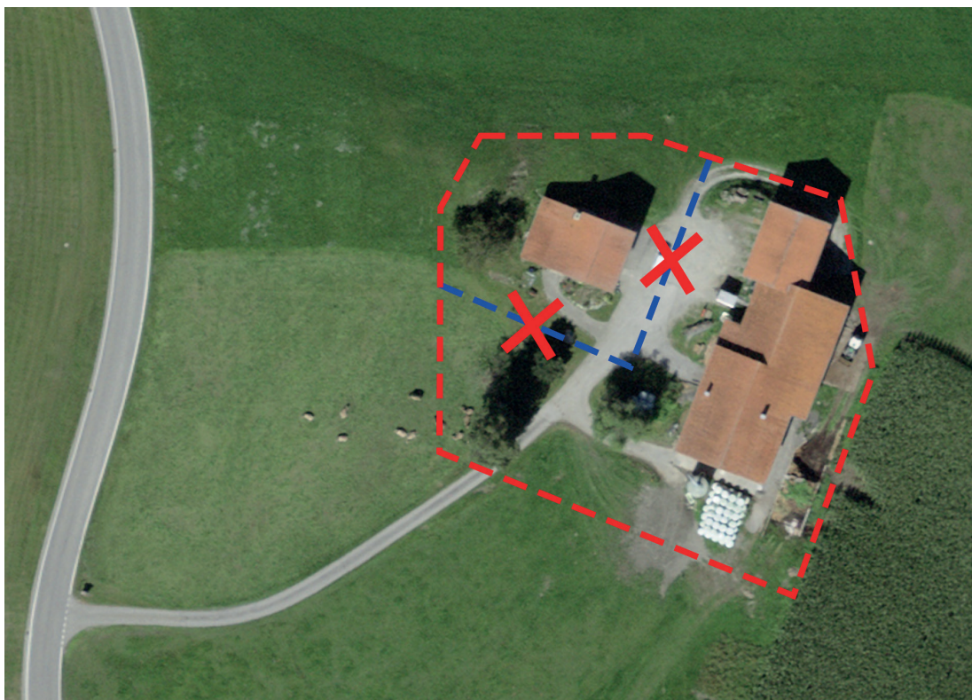
Ill. 3: Nessuna separazione di un edificio all'interno della fattoria