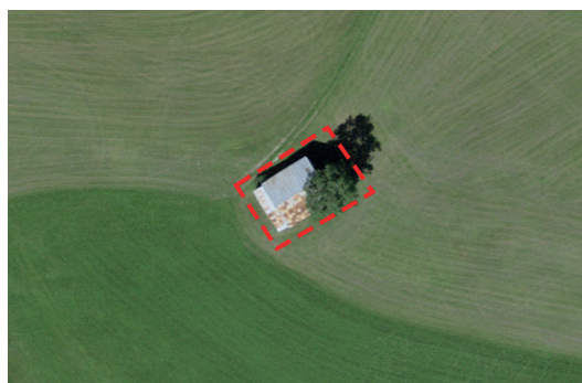
Ill. 2: Separazione di una stalla esterna / di un'abitazione temporanea