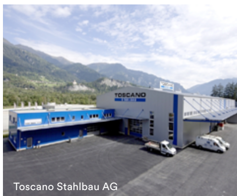
Toscano Stahlbau AG