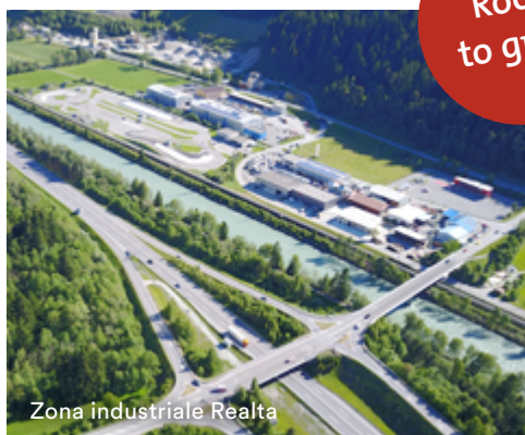
Zona industriale Realta