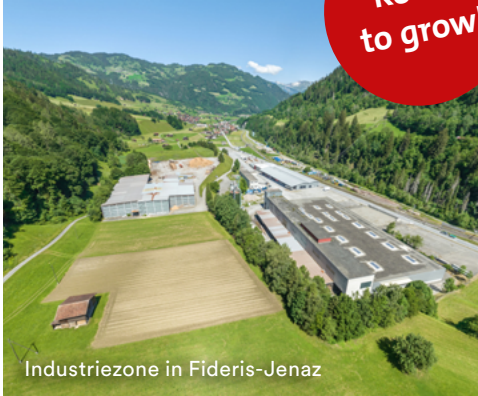
Industriezone in Fideris-Jenaz