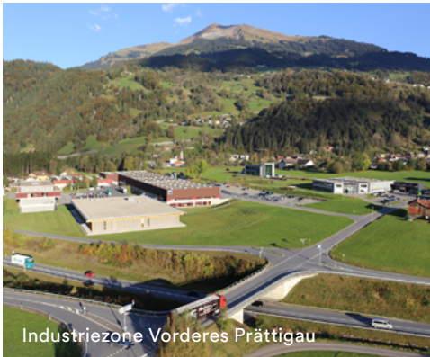
Industriezone Vorderes Prättigau