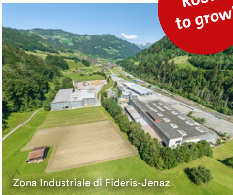
Zona Industriale di Fideris-Jenaz