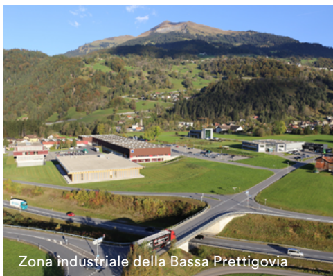
Zona industriale della Bassa Prettigovia