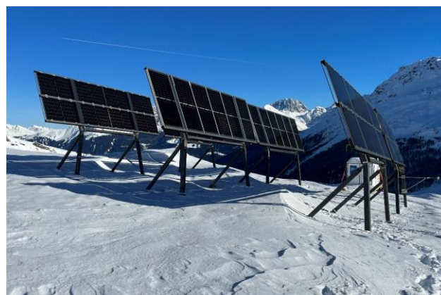
Testanlage Nandro Solar, Surses