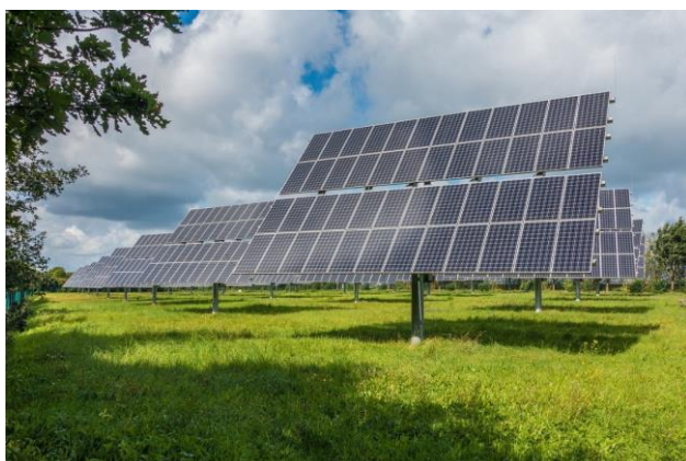
Agri-PV; Einzelstütze