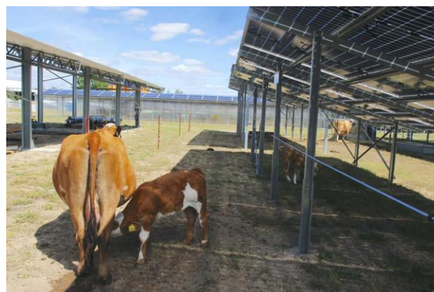
Agri-PV, Neumann top agrar

Die alpinen Photovoltaikanlagen unterscheiden sich hinsichtlich der Tragkonstruktion massgeblich von den Talanlagen. Die vom Ingenieurbüro X STATIK entwickelte Solartischkonstruktion ist die in den meisten Projekten geplante Variante der Verankerung. Die Solarpaneele sind gemäss aktuellem Stand jeweils nicht auf einer einzigen Stütze oder senkrechten Trägern aufgestellt, sondern auf einem Solartisch, welcher auf vier Stahlträgern abgestützt ist. Die Tragkonstruktion wurde von der Testanlage in Tujetsch (Sommer 2023) zur Testanlage Nandro Solar in Surses (Oktober 2023) hinsichtlich einer möglichen Doppelnutzung optimiert. So wurden die Zugseile zwischen den vorderen Hauptträgern entfernt und der Abstützwinkel der hinteren Abstützung von 60° auf 50° reduziert.