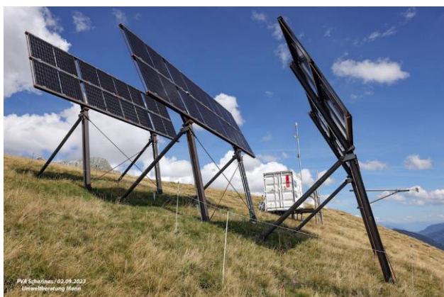
Testanlage Scharinas, Tujetsch

Die alpinen Photovoltaikanlagen unterscheiden sich hinsichtlich der Tragkonstruktion massgeblich von den Talanlagen. Die vom Ingenieurbüro X STATIK entwickelte Solartischkonstruktion ist die in den meisten Projekten geplante Variante der Verankerung. Die Solarpaneele sind gemäss aktuellem Stand jeweils nicht auf einer einzigen Stütze oder senkrechten Trägern aufgestellt, sondern auf einem Solartisch, welcher auf vier Stahlträgern abgestützt ist. Die Tragkonstruktion wurde von der Testanlage in Tujetsch (Sommer 2023) zur Testanlage Nandro Solar in Surses (Oktober 2023) hinsichtlich einer möglichen Doppelnutzung optimiert. So wurden die Zugseile zwischen den vorderen Hauptträgern entfernt und der Abstützwinkel der hinteren Abstützung von 60° auf 50° reduziert.