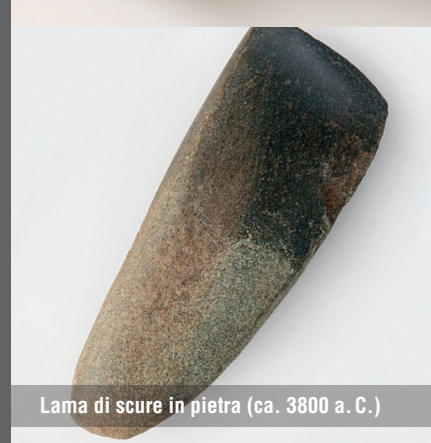
Lama di scure in pietra (ca. 3800 a. C.)