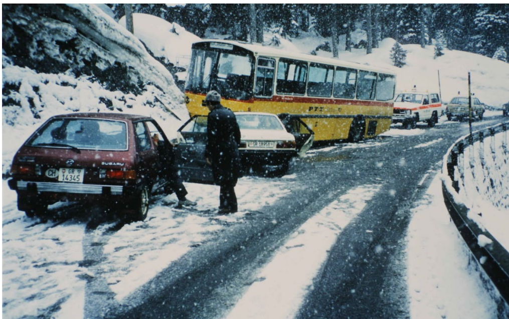
StAGR C11.31 (Dia 6165) Verkehrspolizeiarbeit