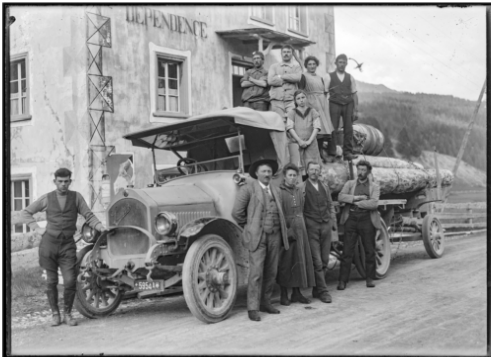
StAGR N2.1588 Gruppenporträt: Gruppe vor Lastwagen mit Holzladung, vor Dependence Gasthaus Sternen, Tschierv