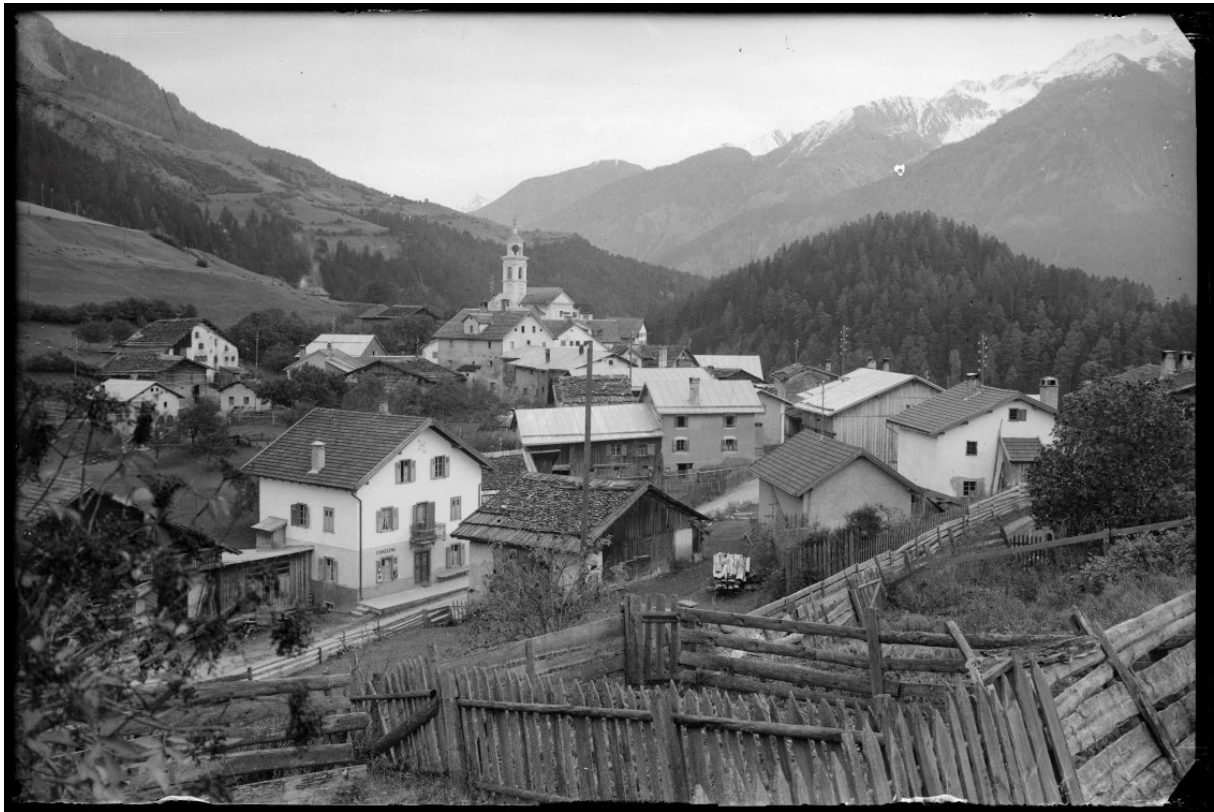
StAGR N11.29 Alvaschein, von Westen (undatiertes Foto, entstanden zwischen 1930 und 1950)

Findmittel PDF / Archivinformationssystem