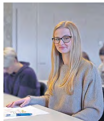
Schätzt die Vorteile der Kombination Schule und Praxis.

männischen Tätigkeitsbereich. Die Absolventinnen und Absolventen können das Jahrespraktikum bereits mit interessanten weiterführenden Angeboten wie dem Bankeneinstieg für Mittelschulabsolventen oder dem Brancheneinstieg in die internationale Speditionslastlogistik kombinieren.