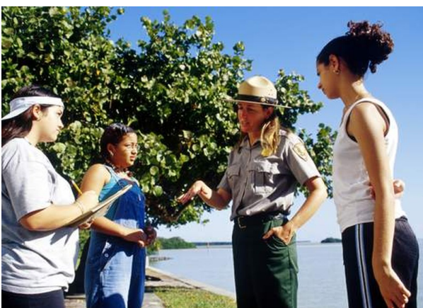
Fragebogen erarbeiten und Interviews führen