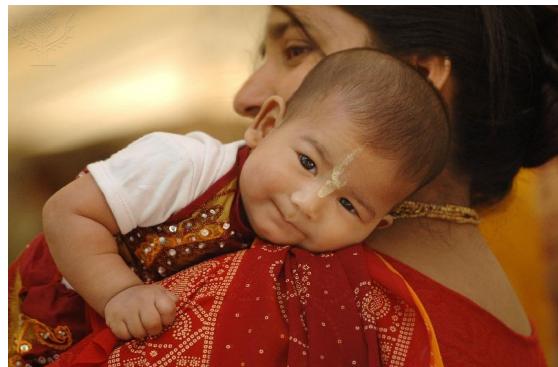
(Wieder-) Geburt im Hinduismus